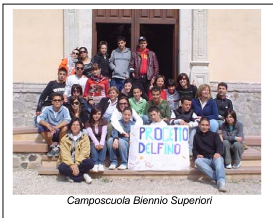
Camposcuola Biennio Superiori