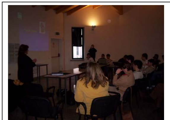
STAGE, TEMPIO, ITI e L.A. Presentazione ai testimoni

I docenti hanno fatto insieme ai ragazzi il percorso della formazione-intervento® nella stessa maniera in cui essi lo hanno fatto loro nelle giornate di formazione-formatori. Hanno individuato un TEMA di miglioramento e lo hanno presentato ai ragazzi.