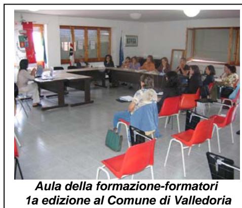
Aula della formazione-formatori 1a edizione al Comune di Valledoria