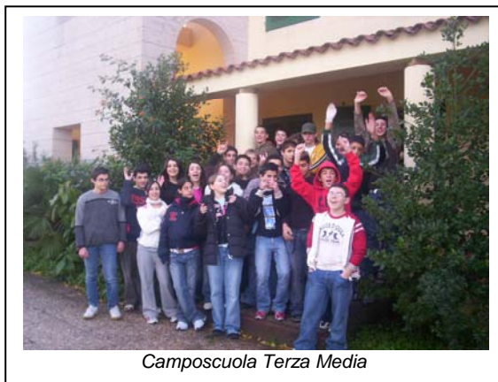
Camposcuola Terza Media

Nelle due edizioni del Campo scuola i ragazzi 25 nel primo e 21 nel secondo, accompagnati da 3 docenti e coadiuvati da 3 animatori hanno lavorato con un programma intenso di formazione-intervento che ha dato come prodotto la progettazione di 6 strumenti immediatamente cantierabili: