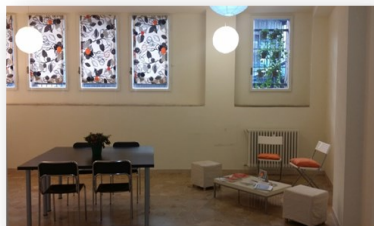
Milano, Via Paisiello n° 24

Riferimenti e approfondimenti IMPRESA INSIEME Srl